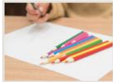
微細運動プログラム

脳バランスキッズは視覚認知機能を向上します。学習に必要な認知機能ワーキングメモリ、注意力、言語と目の動きにもアプローチ。