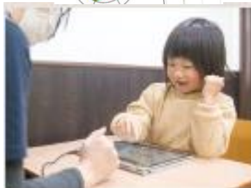
脳バランスキッズ

IQパズルは、学習の基礎となる数・図形・思考力を育てます。また、提供された課題を解決する方法を学ぶことで問題解決能力を養います。